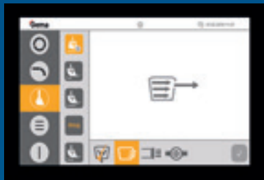
Contrôle de poudre OptiControl