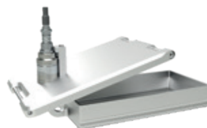
Tamis à ultrason US07