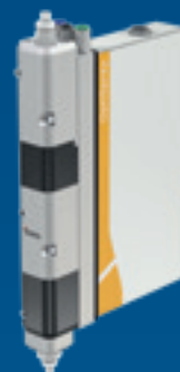
Pompe d'application OptiSpray AP01

L'appareil est équipé d'une fonction de rinçage automatique pour le nettoyage de la pompe, des tubes d'aspiration et du pistolet.