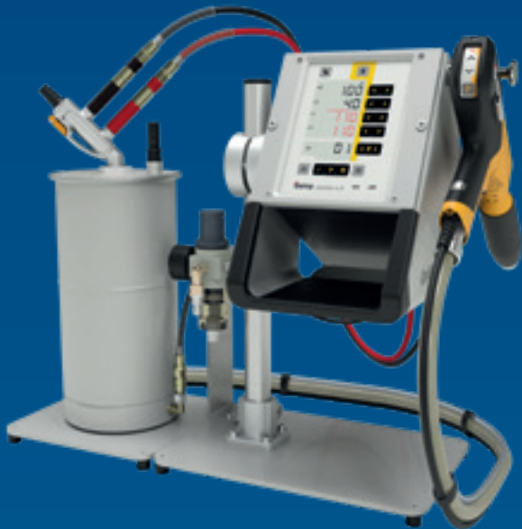
OptiFlex Pro L