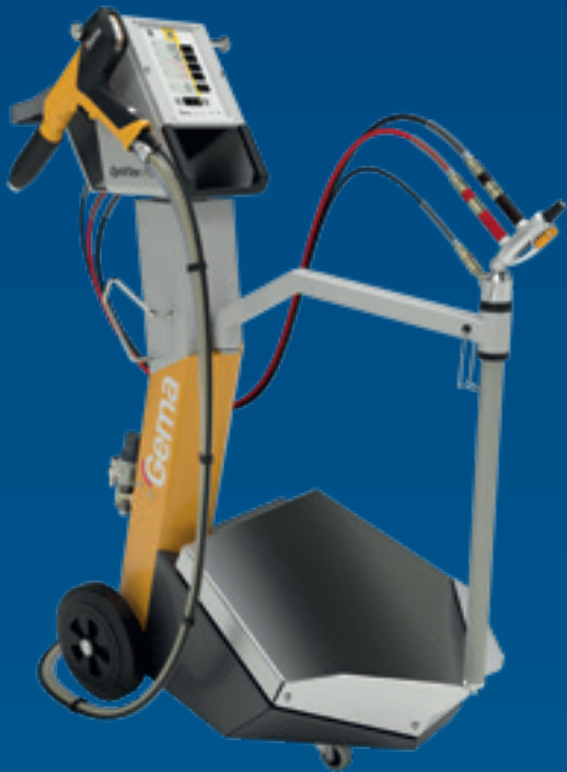
OptiFlex Pro B