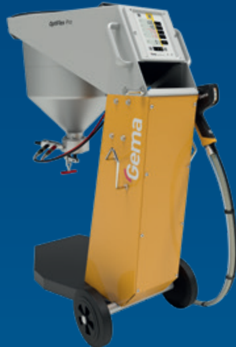
OptiFlex Pro S