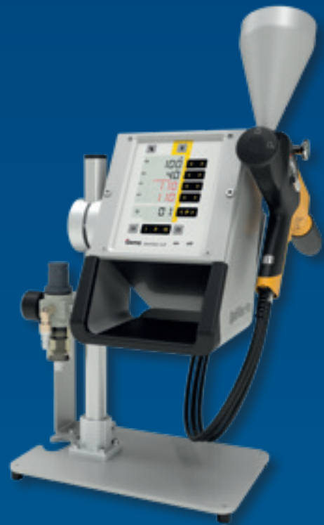
OptiFlex Pro CF