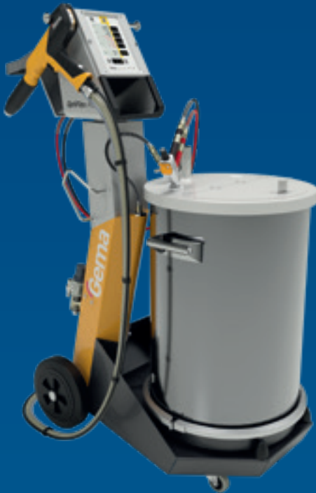
OptiFlex Pro F