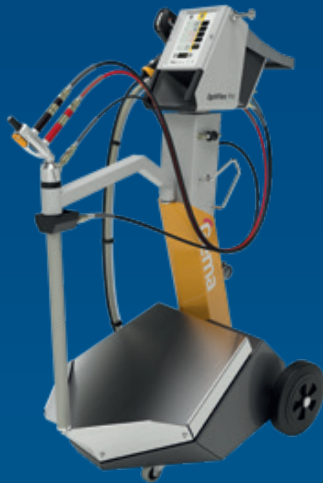
OptiFlex Pro Q