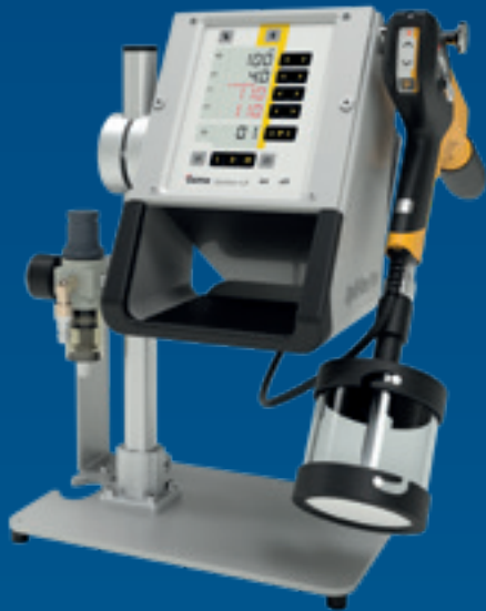
OptiFlex Pro C