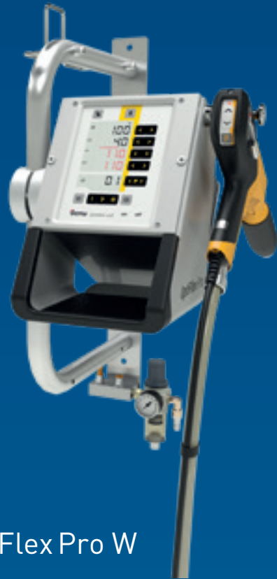
OptiFlex Pro W