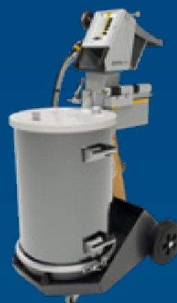
OptiFlex Pro F Spray