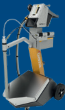
OptiFlex Pro B Spray