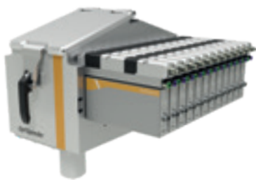
Tolva de polvo OptiSpeeder

El cambio desde el polvo fresco hasta la operación de recuperación y el modo de limpieza es completamente automático.