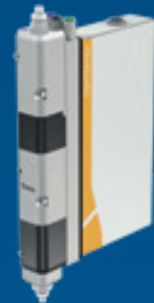
Bomba de aplicación OptiSpray AP01

El dispositivo está equipado con una función de enjuague automático que limpia la bomba, los tubos de succión y la pistola.