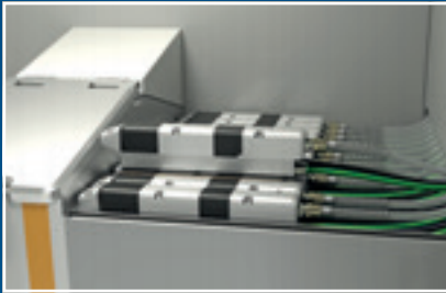
OptiSpeeder con OptiSpray AP01

El corazón de OptiCenter es la tolva de polvo OptiSpeeder, que acondiciona de manera óptima el polvo mediante fluidización. La nueva OptiSpeeder tiene una gran apertura inclinada que permite acceder rápida y fácilmente y ver el interior del contenedor de polvo.