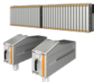
Intégration de l'OptiSpray All-in-One dans les deux OptiSpeeders d'un OC11 (technologie DualSpeeder)