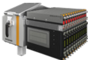
Intégration de l'OptiSpray All-in-One dans une OptiSpeeder (trémie de poudre) d'un OC10

Les pompes d'application OptiSpray All-in-One et OptiSpray sont équipées en standard des OptiCenters All-in-One (centre de gestion des poudres), ce qui garantit une grande flexibilité et des résultats optimaux de revêtement.