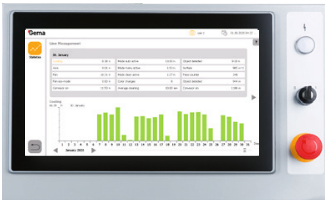
Übersichtliche Visualisierung der Produktionsdaten in der MagicControl 4.0

Der Anwender erhält somit einen vertieften Einblick in die Auslastung und Effizienz der Anlage und kann dadurch Verbesserungspotentiale der Produktionslogistik erkennen, Prozessoptimierungen vornehmen und die Anlagenverfügbarkeit und schließlich die Produktivität steigern.