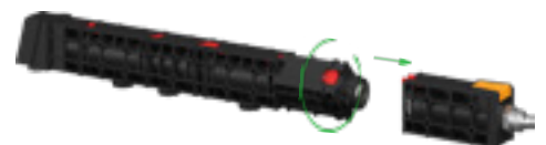
Werkzeugloser und schnellster Zugang zu allen Verschleissteilen

Your global partner for high quality powder coating