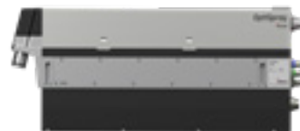
OptiSpray (AP02) Applikationspumpe