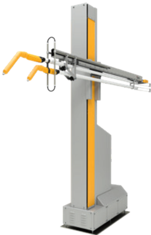
Eje multipistola UA05-2 con 2 pistolas y anillo de soplado