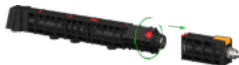
Acceso rápido y sin herramientas a todas las piezas de desgaste

Your global partner for high quality powder coating