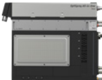
OptiSpray All-in-One (CG26-CP) combina en un mismo dispositivo la tecnología de alimentación de polvo y el control de la electrostática

El exclusivo sistema de una cámara de la bomba garantiza un caudal de polvo uniforme, resultados de recubrimiento homogéneos y un ahorro de polvo considerable.