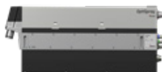
Bomba de aplicación OptiSpray (AP02)